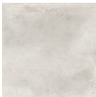
INDUSTRIAL HALL OFF WHITE P1212L