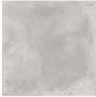
INDUSTRIAL HALL LIGHT GREY P1212L