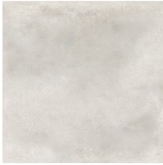
INDUSTRIAL HALL OFF WHITE P1212L