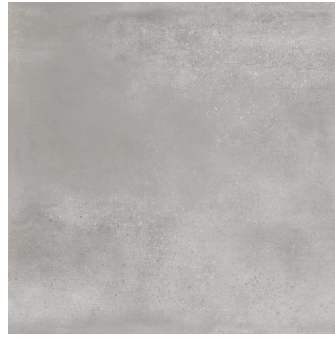
INDUSTRIAL HALL MEDIUM GREY P1212L